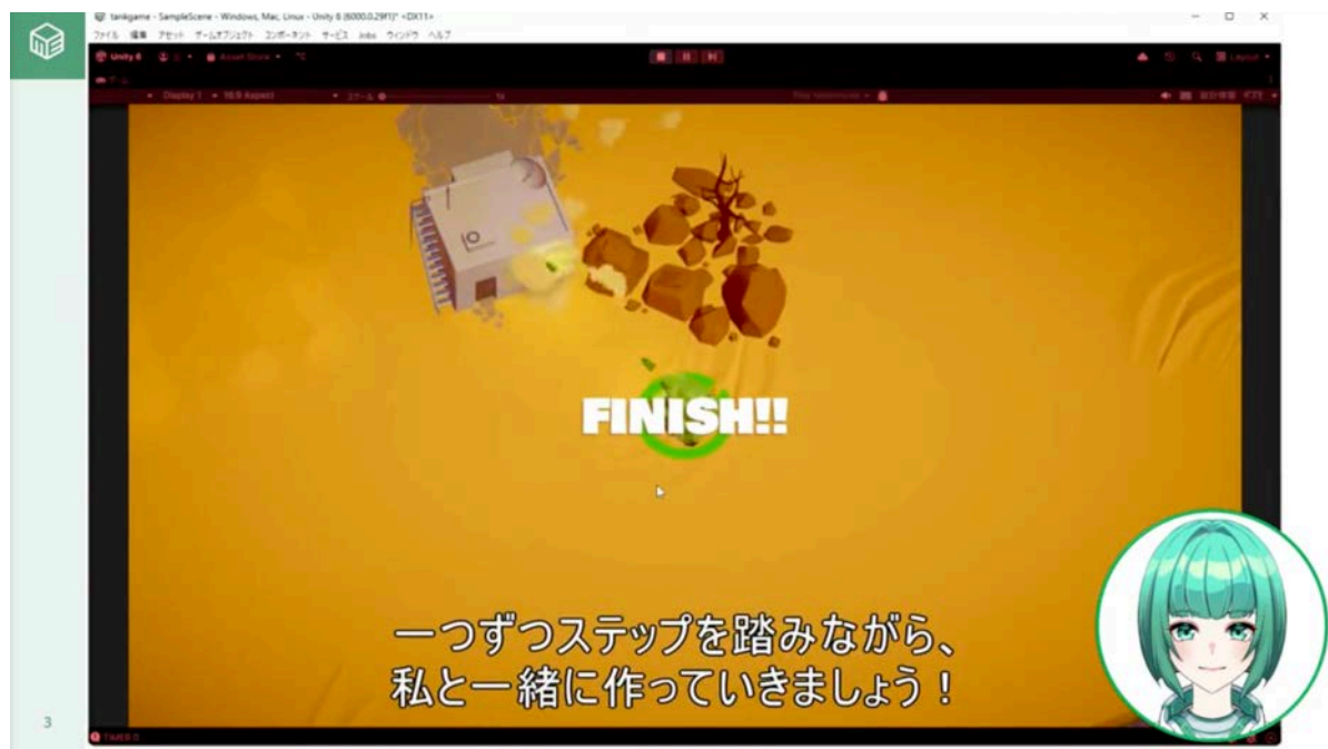
体験入学の動画教材