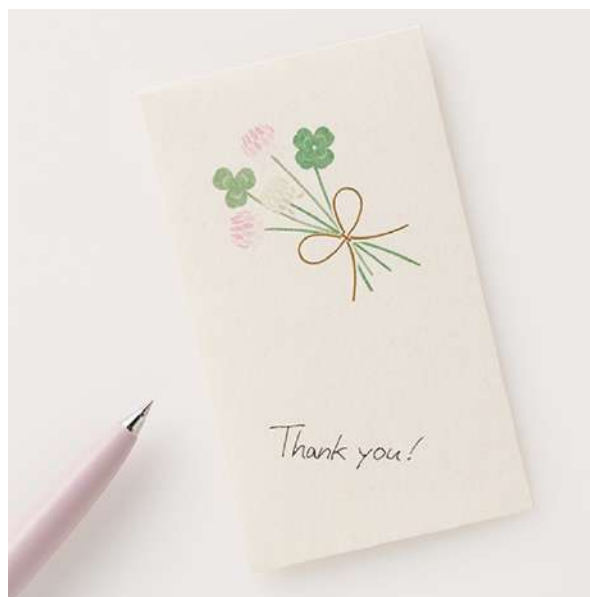
表面の余白に名前やメッセージを書き込むことができる

同時発売するばち袋は、万円袋と同ラインアップの「ガーベラ」「チューリップ」「ミモザ」「スマイレ」「クローバー」の全5種です。表書きが印刷されていないデザインのためシーンを問わず、特別な場面やちょっとしたやりとりにも気軽に使用することができます。表面の余白に名前やメッセージを書き込むことで、より丁寧に気持ちを伝えることができます。