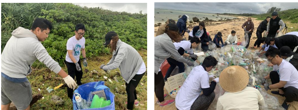
▲ドトールコーヒーとのビーチクリーン活動の様子

ユニフォームの製作だけでなく、顧客とともに実際にビーチクリーン活動を行うことで、環境問題を身近に考えるきっかけに、そして循環の輪が未来に広がっていくことを願っています。