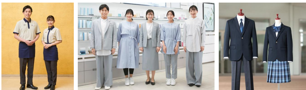
▲左からドトールコーヒーショップ、FANCL、八王子学園の新制服