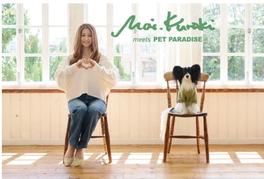
Mai Kuraki meets PET PARADISE ページ: