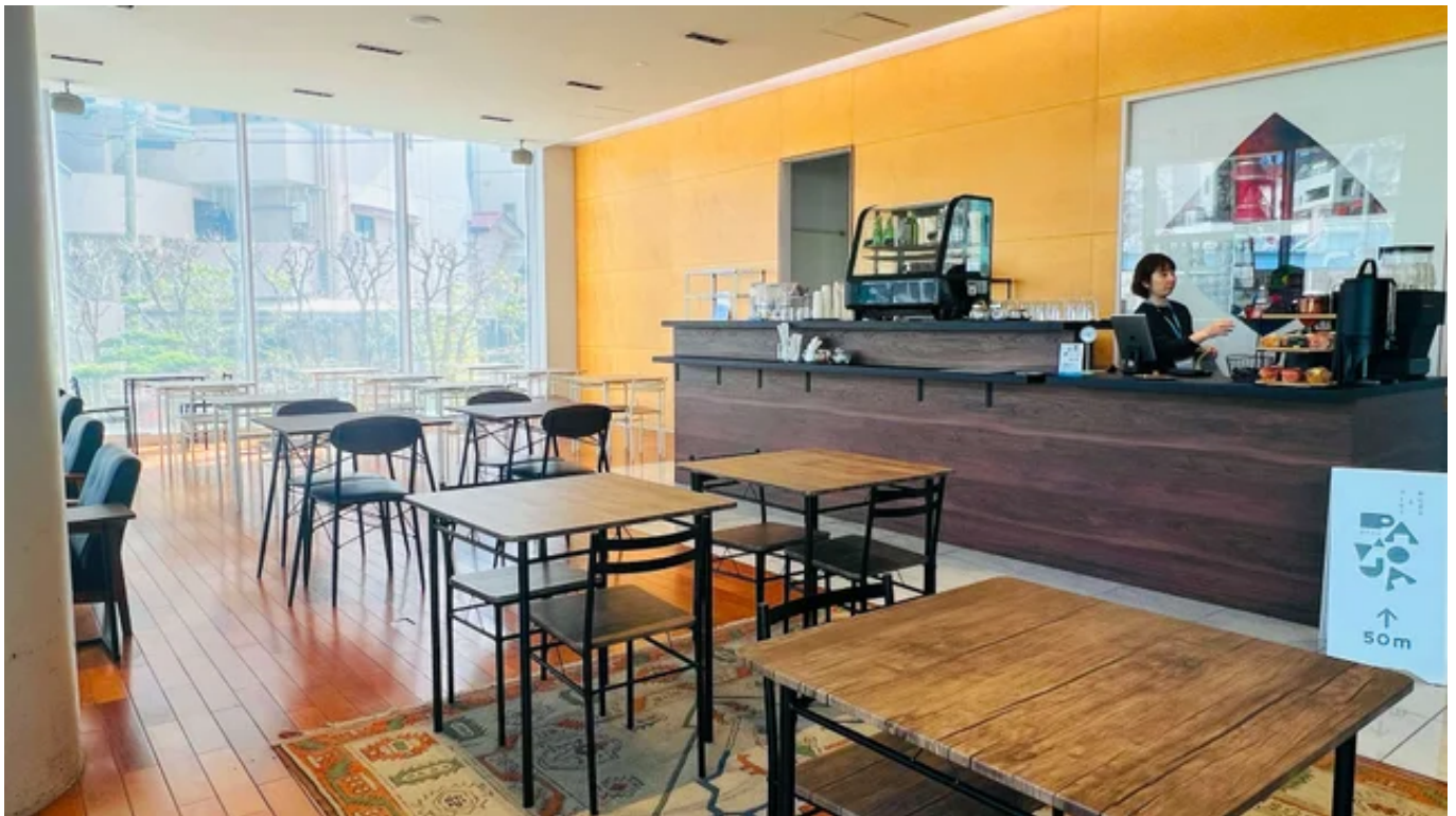
代々木公園店（渋谷区）

「コーヒーとおにぎりPAMOJA」では、店舗ごとに異なる楽しみ方をご提供しています。神保町店では、ボリュームたっぷりのごはんメニューでしっかり食事を楽しみたい方にぴったり。代々木公園店では、ティータイムとおにぎりを中心とした軽やかなメニューで、ほっとひと息つけるカフェ時間をお届けします。どちらも体に優しく元気が出るヘルシーメニューを揃え、皆様のご来店をお待ちしています！