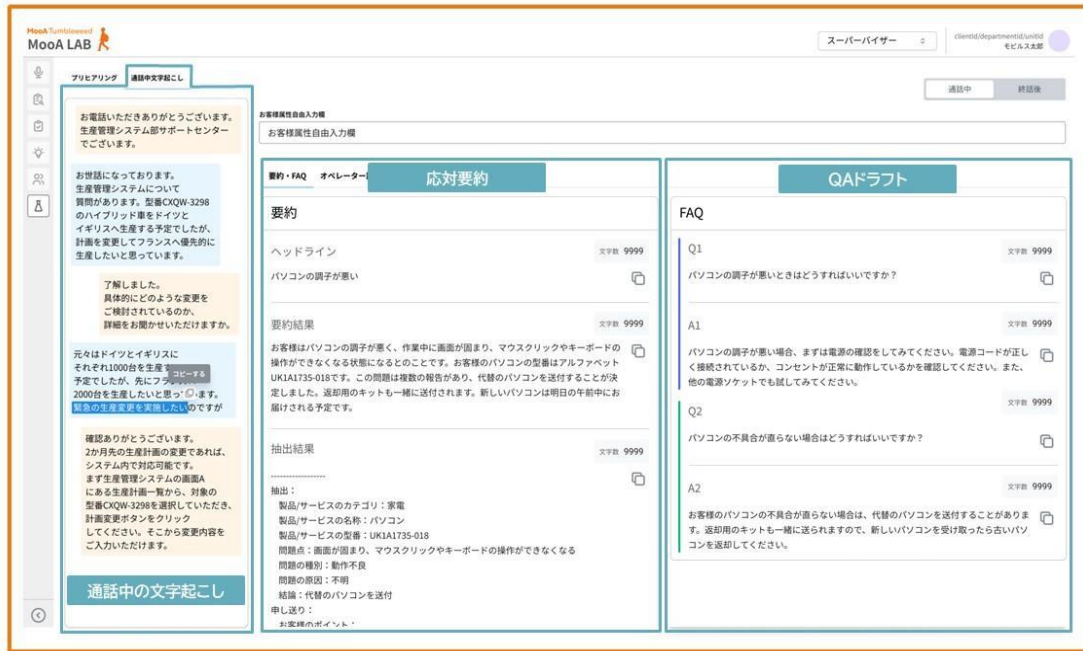
「MooA CommNavi」での操作画面イメージ(通話中文字起こし、対応要約、QAドラフト生成など)