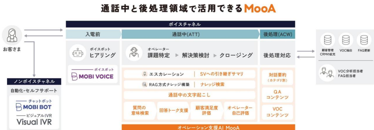
「MooA CommNavi」と「MooA KnowledgeBase」の全体イメージ

これらの新機能により、「つながる」お客さま窓口の確立に向け、慢性的なオペレーター不足問題の解決やコンタクトセンター業務の属人化解消が可能となります。