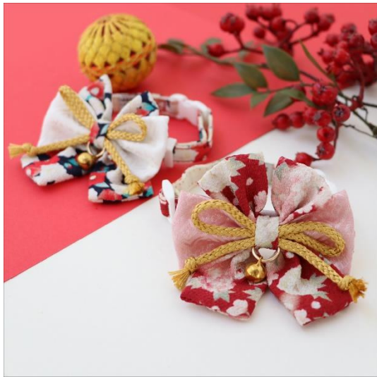
和帯猫首輪(紺/赤) 2 サイズ展開 3,960 円(税込)