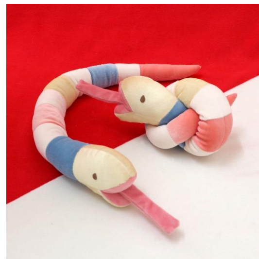
和猫もちへびトイ 1,650 円(税込)