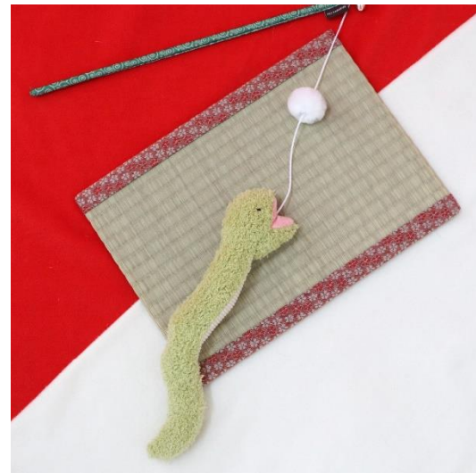
和へびくんじゃらし 1,760 円(税込)