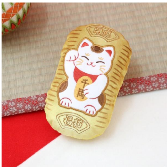
和まねき猫小判トイ 990 円(税込)