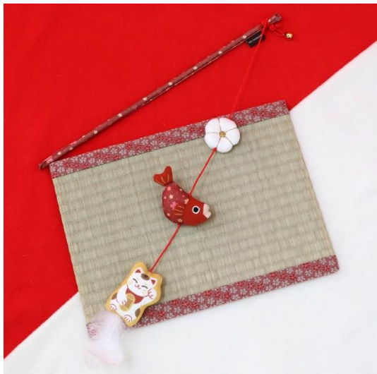
和まねき猫じゃらし 2,420 円(税込)