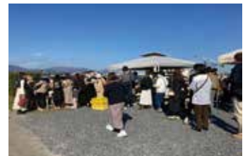
昨年の窯出市の様子

自然界の有限な資源を使って製造しているにも関わらず、わずかな傷や色合いの違いで品質に損傷はなくともこれらの商品が日々廃棄される事へ疑問を感じ、2005年より年に一度わけあり商品として消費者の方にお値打ちに提供させていたイベント「窯出市」。そのコンセプトを引き継ぎながら今秋より名称、内容を変更しました。