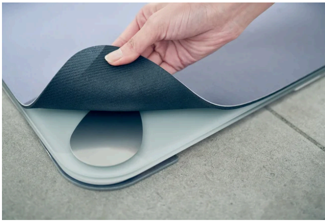
取り替え用ソフト珪藻土マット