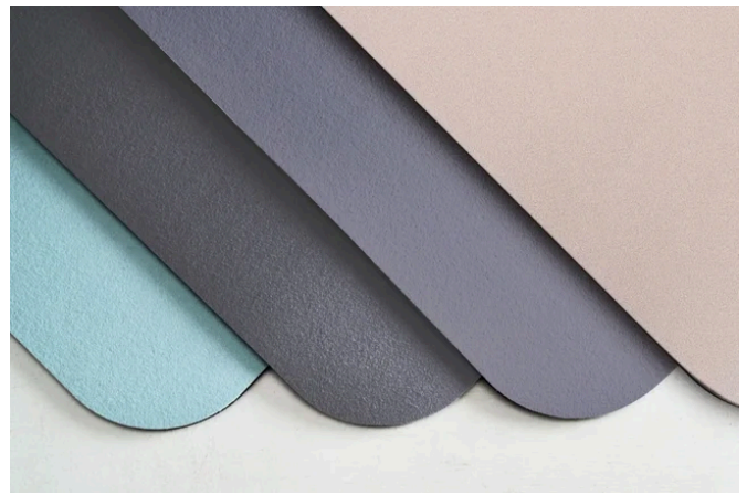
取り替え用ソフト珪藻土マット