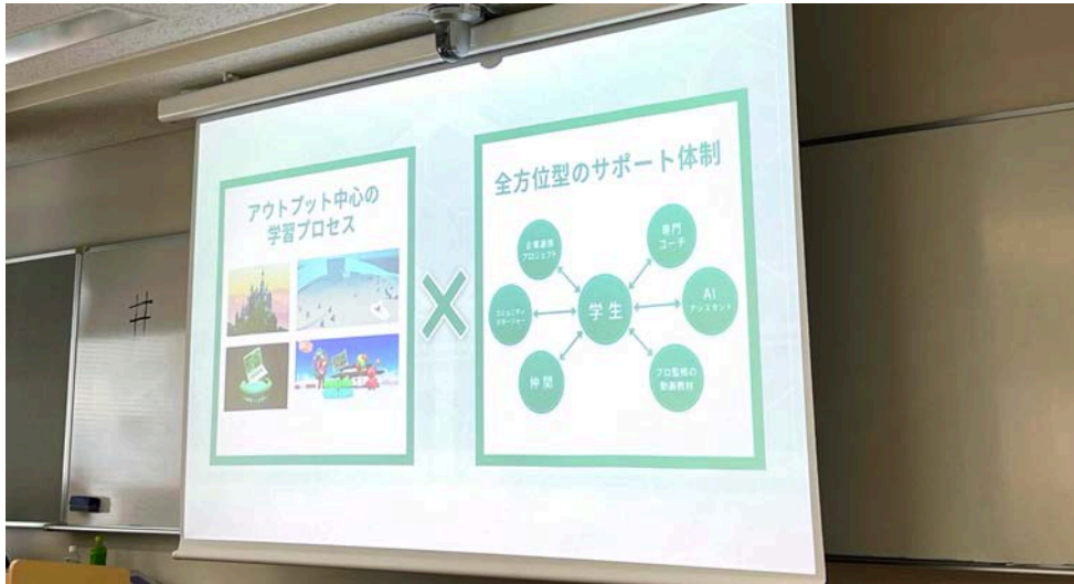
イベント当日のMEキャンパス紹介の様子

公式サイト： https://www.iueo.or.jp/iueosummer2024