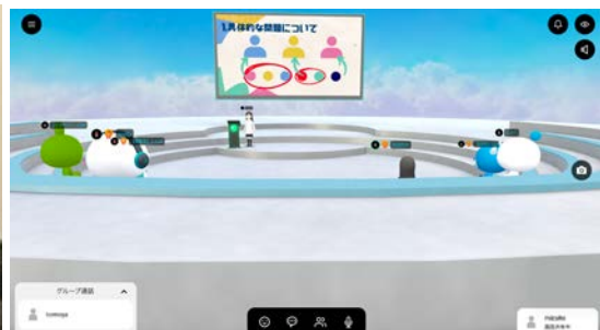
メタバース空間で行った会議の様子