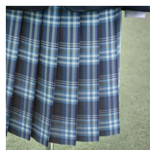
▲縞縷色をベースにしたスカート