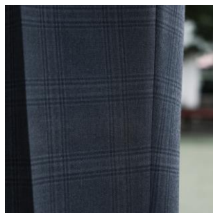
▲シャドーストライプ柄スラックス

ユナイテッドアローズ社の社名に込められた「ひとつの目標に向かって直進する矢（ARROW）を束ねた（UNITED）もの」と、八王子学園の学問・スポーツ・芸術など多様な個性を持つ生徒たちが一体となって学園生活を創り上げていく姿に親和性を感じ、これからの多様化する社会を乗り越えていく制服のイメージを体現するブランドにふさわしいと考え、コラボレーションを依頼しました。スラックスに学校制服では珍しいシャドーチェック柄を、ネクタイとリボンにはレジメンタルストライプ柄を採用し、無地のメタリックなボタンをデザインのアクセントに取り入れました。時代を経ても生徒から愛され、憧れられる制服が完成しました。