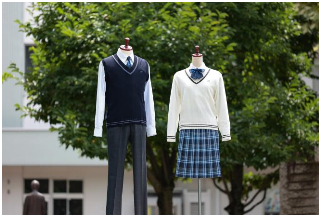
▲ベストスタイルとセータースタイル

学生服では、ジャケット・シャツの前合わせが男女別になっていることが一般的ですが、新制服では、ジャケット・シャツの前合わせを男女統一し、ジェンダーレスなデザインを採用しました。また、全生徒がスラックスを選択することも可能です。