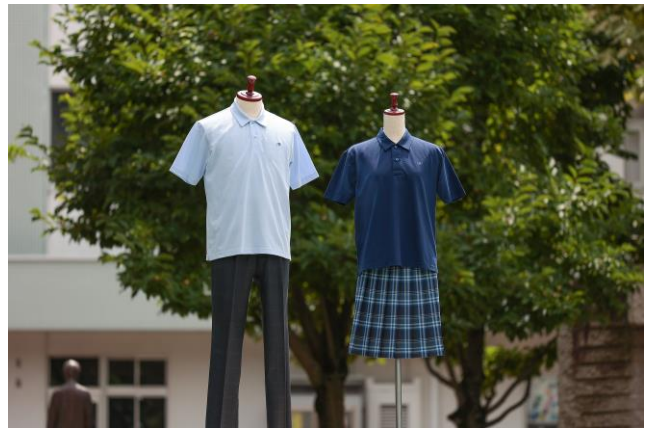
▲ポロシャツスタイル