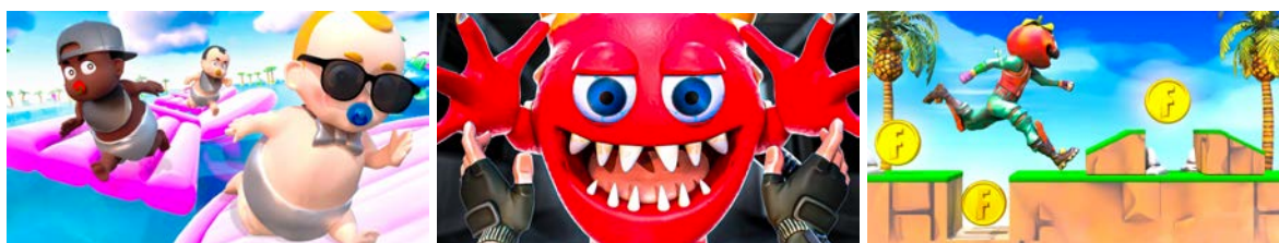
BABY RUN !!

代表作『Baby Run!!』は単独で500万プレイを突破する人気タイトルとして、世界中のプレイヤーに楽しまれています。