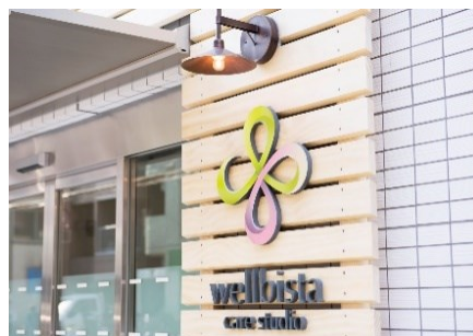
1号店「ウェルビスタ ケアスタジオ 中野新橋」外観

積極的な出店を行い、「ウェルビスタ ケアスタジオ」を通じて、多くの方々のリハビリテーションを支援してまいります。また、身体的自由を取り戻すだけでなく、精神的・社会的にも良好な状態を実現するために、さまざまなサービスを提供していきます。