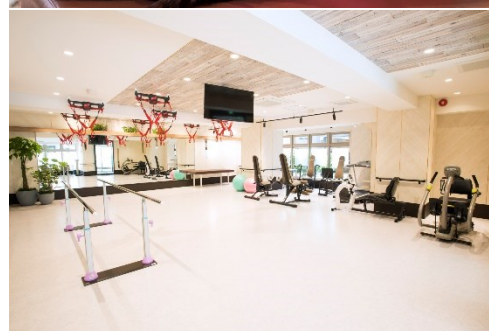
(上)保険外個別リハビリサービス一例 (下)1号店「ウェルビスタ ケアスタジオ 中野新橋」内観