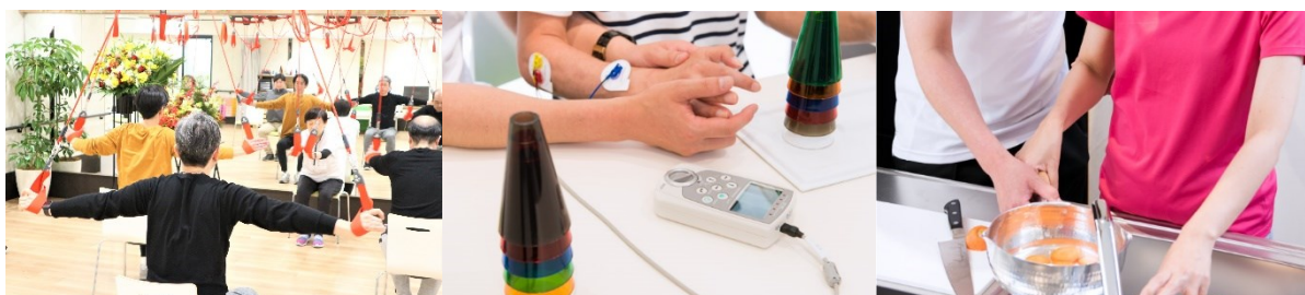
(左)介護保険サービス(機能訓練型デイサービス)一例_2、(中)(右)保険外個別リハビリ一例

その他の「お客様の声」は こちら からご覧いただけます( https://wellbista-cs.com/#voice )