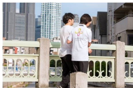
保険外個別リハビリサービス(一例)

「リモートで仕事はしているものの、右半身の麻痺のため、通勤や家族と外出する機会が少なく、引きこもりがちでした。施設のスタッフの方々がオーダーメイドのリハビリを提案くださり、少しずつ足の動きが改善されました。自力でタクシーに乗り降りできるようになり、自信ができました。その後も歩行トレーニングを続け、歩行速度が上がり、家族との楽しい外出も実現できました。」