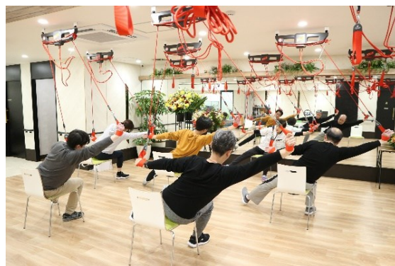
介護保険サービス(機能訓練型デイサービス)イメージ

介護保険サービス(機能訓練型デイサービス)と保険外個別リハビリサービスを同一施設内で組み合わせて提供する施設は、東京都内では唯一(*2)の存在です。コンセプトは「必要なときに必要なリハビリを、なりたい姿をかたちにする『WELL-BEING AGAIN』」です。お客様の身体的・精神的・社会的に良好な状態を向上させることを目指しています。