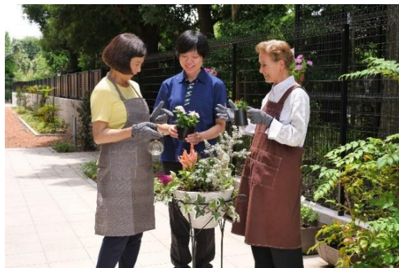
ガーデニング(イメージ)

運動の時間に加えて、お客様の興味や希望に応じた多彩なプログラムを提供します。パソコン利用や実験、工作、花木のお手入れなど様々な活動を楽しんでいただけます。また、芸術鑑賞、音楽セッション、料理教室、ガーデニング、触感ゲームなどのレクリエーションもご用意し、お客様自身が楽しみながら達成感を感じられるような交流の場を提供します。