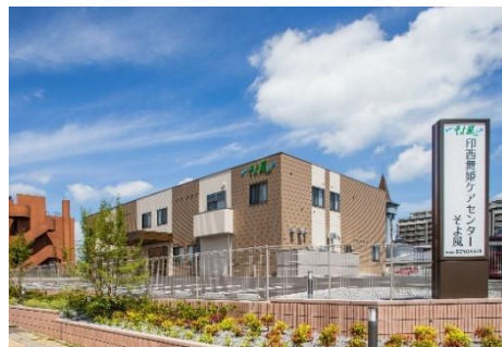
7月開設「印西舞姫ケアセンターそよ風」施設外観

「印西舞姫ケアセンターそよ風」は、日帰りで施設に通うデイサービスと短期滞在が可能なショートステイを提供する複合施設です。コンセプトは「お客様のニーズに応え、楽しむことを愉しみ笑顔で過ごせる介護施設」。お客様一人ひとりに合わせたサービスを提供し、日々の生活を楽しく、やりがいを感じていただけるよう、充実したプログラムをご用意しています。