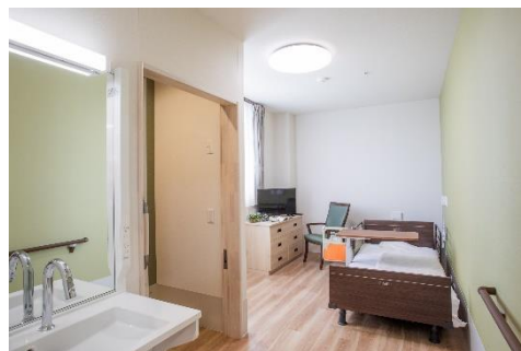
ショートステイ居室一例

同のアクティビティを提供いたします。全室に見守り支援システムを導入し、夜間も安心してお過ごしいただけます。