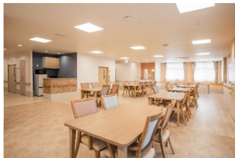
柱のない広々とした食堂兼機能訓練室

「印西舞姫ケアセンターそよ風」は、日帰りで施設に通うデイサービスと短期滞在が可能なショートステイを提供する複合施設です。コンセプトは「お客様のニーズに応え、楽しむことを愉しみ笑顔で過ごせる介護施設」。お客様一人ひとりに合わせたサービスを提供し、日々の生活を楽しく、やりがいを感じていただけるよう、充実したプログラムをご用意しています。