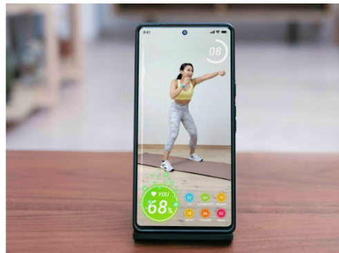
専用エクササイズアプリ