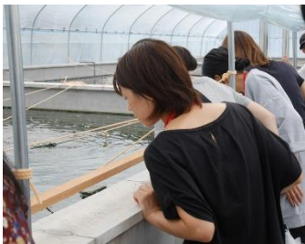
ビニールハウス内見学

『すっぽん小町』の愛飲者であるユーザーに、原材料であるすっぽん養殖場の全てを包み隠さず紹介するツアーです。北海道や沖縄など全国各地から参加する約8名のユーザーと福岡空港で集合し、車で約1時間移動。到着した産地では生簀やビニールハウス見学に加え、エサやり体験を行います。最後に生産者への質問コーナーを設けており、ツアー時間が延長されるほど盛り上がります。ツアーの様子や参加者へのインタビューは、ユーザー向けに販促紙で掲載しており、こちらも好評です。