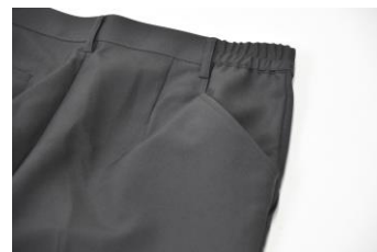
▲マイクシャワー専用ポケット