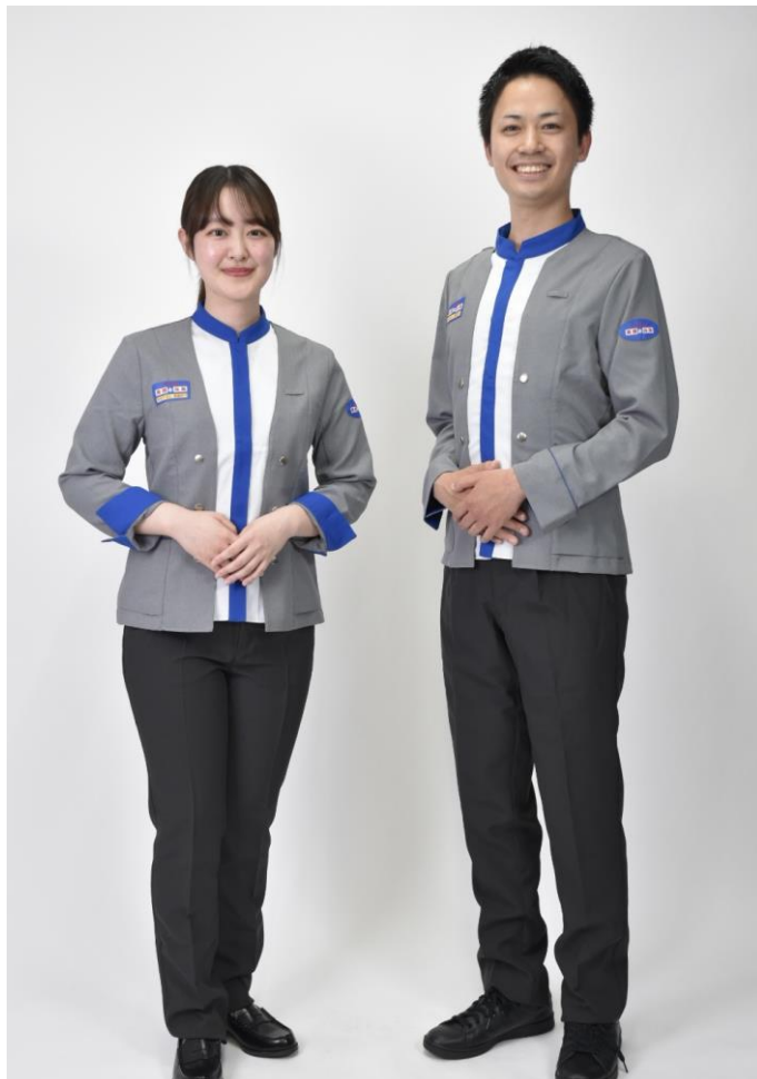
▲2024年5月1日から着用の新ユニフォーム

10年ぶりとなる新ユニフォームは、これまで同様高級感を演出しつつ、縦ラインが特徴的なトップスでシャープな印象のデザインです。また、新型コロナウイルス感染症の拡大以後、消毒のためのマイクシャワーやミニボトル消毒液など、従業員の携行品が増えたため、新制服では専用ポケットを設けて収納力を向上させています。