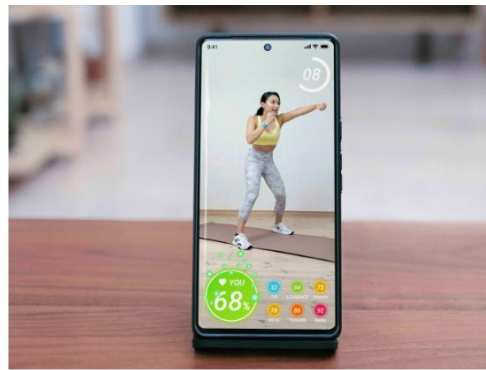
専用エクササイズアプリ