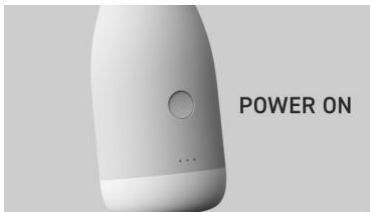
1: ボタンを押して加熱開始