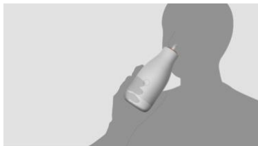
3: 再度ボタンを押してショット