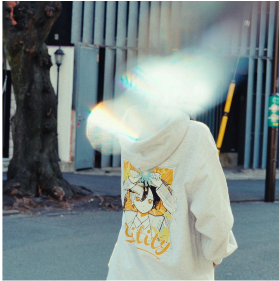
長瀬有花 × utility × 並河泰平「Hoodie」