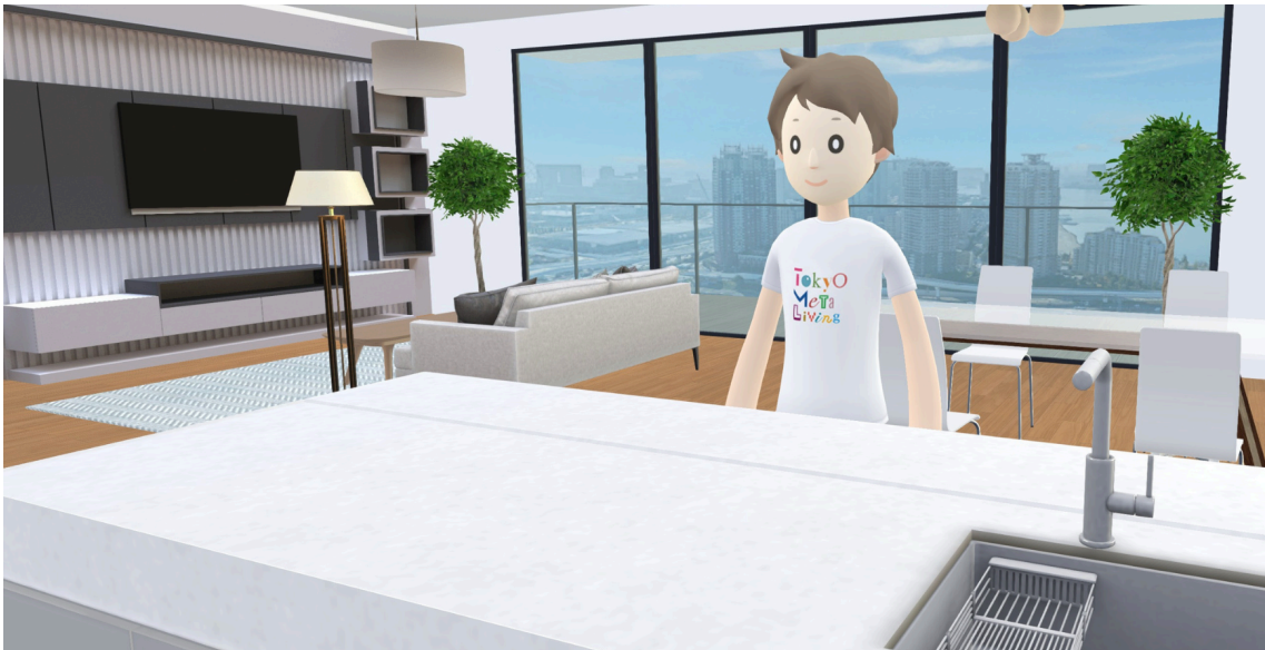
「Tokyo Meta Living」イメージ

URL : https://tokyometaliving.brillia.com/