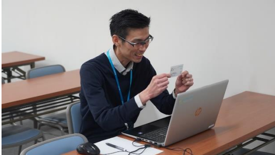
▲接客部門での実演の様子