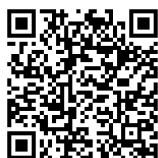
一般社団法人 日本イベント産業振興協会