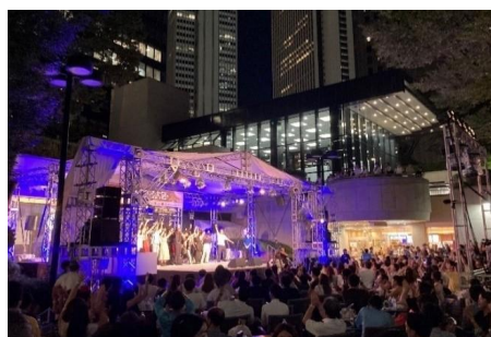
「第46回 新宿三井ビルディング 会社対抗 のど自慢大会」4年ぶりに開催！ 2023年8月25日