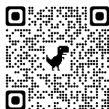
株式会社明光ネットワークジャパ ングループ総会レポート