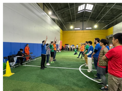
防災テックベンチャー、初社内イベントで防 災運動会を開催！株式会社Spectee 2023年11月10日