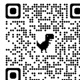
株式会社Spectee 初の全社イベントに密着レポート