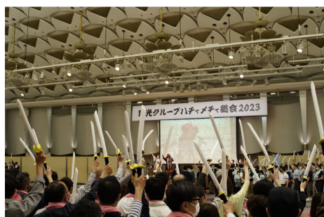
「明光ネットワークジャパングループ総会」 1,000名参集でチャンバラ合戦！ 2023年5月14日