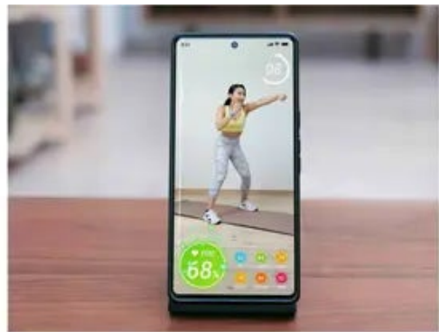
専用エクササイズアプリ