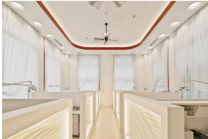
〈吉井矯正歯科クリニックの診察室〉

WELL 認証*…建物を空気の質や光、水質など複数の項目で評価し、建物の利用者の心身の健康に配慮されているかに焦点を当てた指標のこと