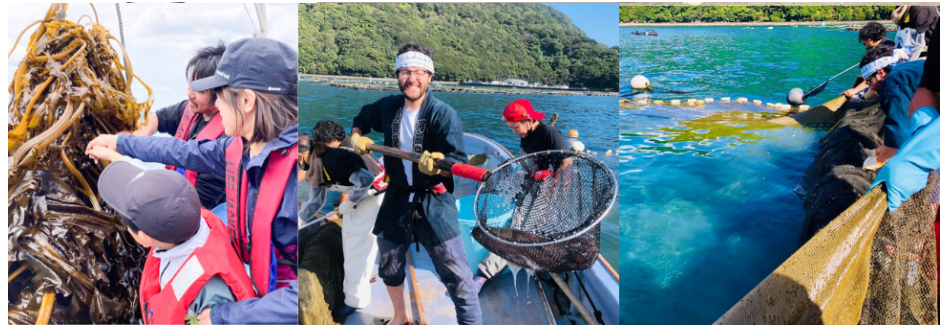
※丘漁師ツアーの様子