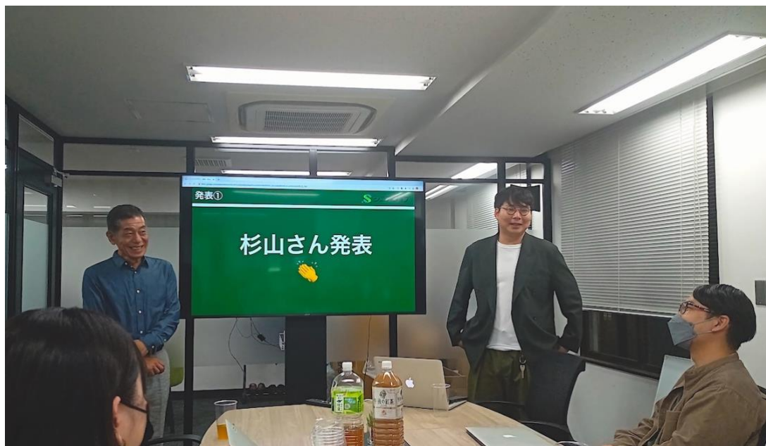
10月13日に開催されたシニア社員の失敗体験を聞く「しくじりアカデミー」の様子、62歳社員の発表に若手社員が耳を傾ける

元公務員の62歳の社員などが「これまでのキャリアでのしくじり」のほか、事前に要望のあった、転職活動時の苦労話や、転職先での序盤の苦労話なども含めて発表を行いました。