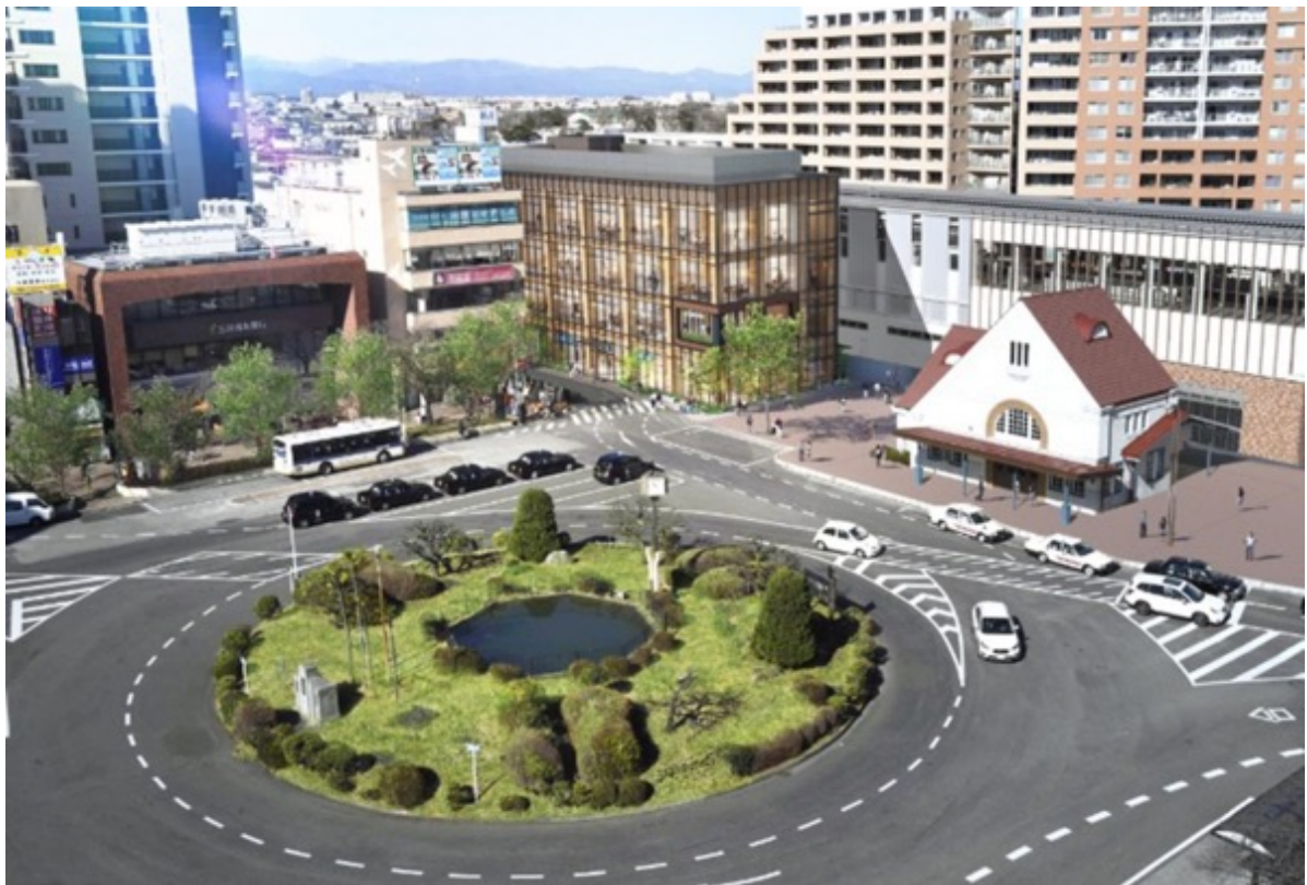
外観イメージ 国立駅南口駅前広場全景

2023/3/7[JR 東日本グループ初の木造商業ビル(仮称)nonowa 国立 SOUTH 着工のお知らせ]