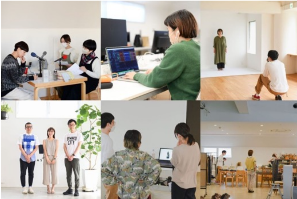
現在のオフィスの様子

そのような社員が働く姿は、「北欧、暮らしの道具店」やコーポレートサイトにて、テキスト、動画、ポッドキャストなどさまざまなコンテンツとして発信しており(*2)、その舞台となるオフィスは当社の理念を顧客や各ステークホルダーと共有するために欠かせない重要な役割を果たしてきました。