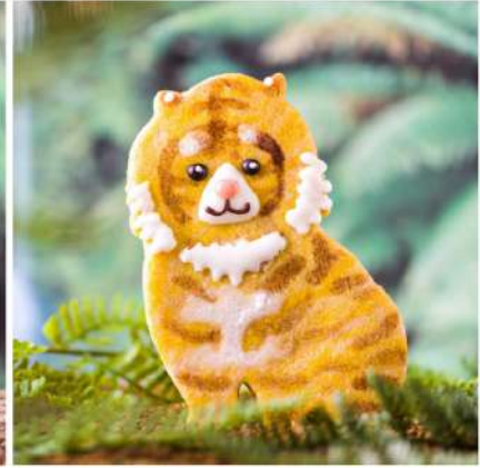
スマトラトラのオスの特徴はたてがみ。虎耳状斑にも着目。新舎では運動場をのぞき込むトンネルが設置され、迫力を間近で感じられる。