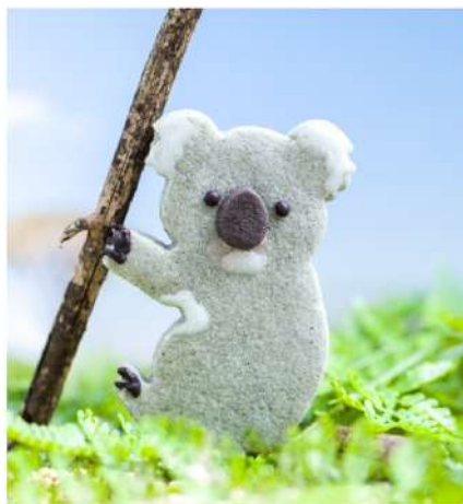
木にしがみつく器用な手と爪を表現 コアラの鼻は年齢と共に 口元に近い部分がピンク色に