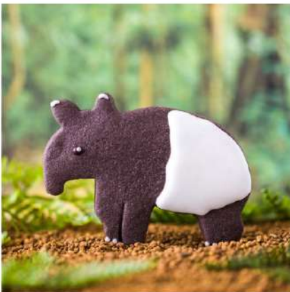
マレーバクの大きな特徴は長めの鼻と保護色である白黒のツートンカラー。耳先が輪郭に沿って少し白い。