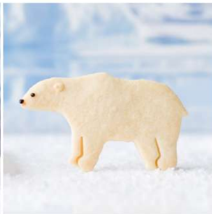
ホッキョクグマは頭は体のわりに小さく直線的で泳ぐのに適した体のライン。雪や氷の上でも歩きやすいよう手足が大きい。白い毛は実は透明で空洞。