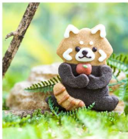
シセンレッサーパンダはリンゴも好き 身体の色の特徴は2つのフレーバーで