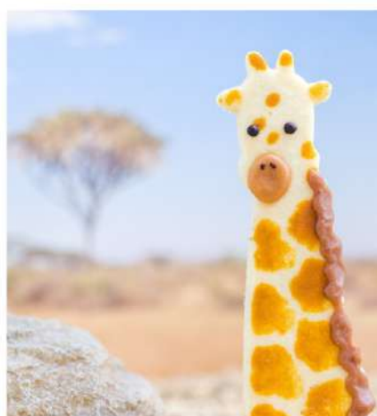
アミメキリンの網目の出し方を意識 キリン=黄色× キリンは白色○