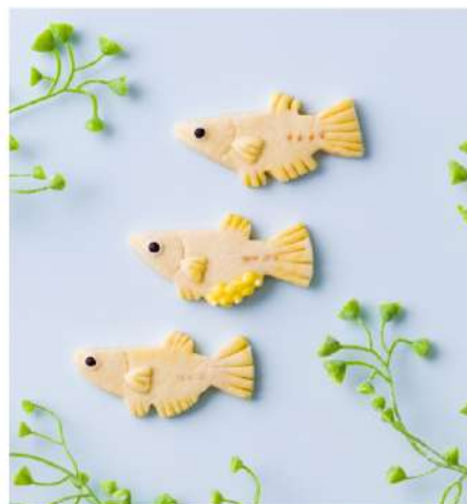
雄雌のヒレの違いを捉えたクロメダカ オス=背ヒレの切れ込み メス=尻ヒレは小さめ