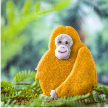
樹上でほぼ一生を過ごすオランウータン。新舎では15mのポールを複数配置。オレンジの鮮やかな長い毛並みを表現。