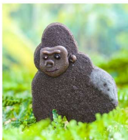
成熟したニシゴリラのオスは 背中が銀白色の毛に覆われている シャバーニの立派な頭の盛り上がりにも注目