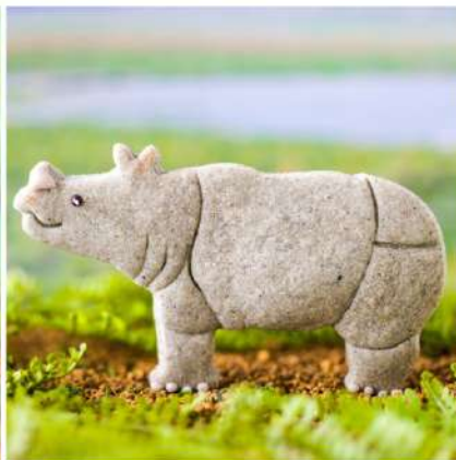
鎧のような皮膚を持つインドサイ。少し尖った上唇も特徴的で、自在に動かしてエサを食べることができる。意外と脚が細め。