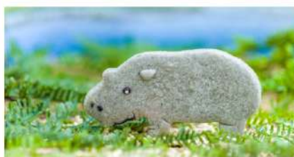
コビトカバとカバの体の特徴の違い (脚や首元、顔のライン・しわの位置等)