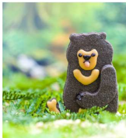
胸元のオレンジマークが太陽に見えることから サンベアーと呼ばれているマレーグマ 愛くるしい体の動きと木登り上手な爪を表現