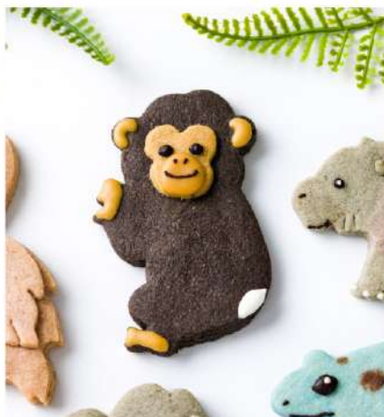
肌色の皮膚とおしりの白い毛で チンパンジーの子どもを表現