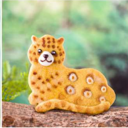
模様が特徴的なジャガー。新舎では斜面を駆け回り、プールに飛び込む姿が見られる。模様の斑点が特徴的。