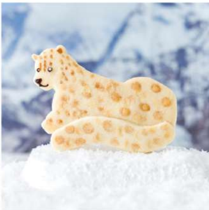
ユキヒョウは高山地帯の雪の上でも動きやすいように、大きな掌（足裏）と長く太いシッポが特徴。長く密集した美しい毛並みを持つ。