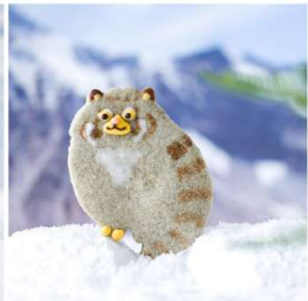
マヌルネコは岩場や茂みに隠れ姿勢を低くして狩りをするため、顔が横に広い。寒冷地に適した密な長い毛も特徴。普通の猫より瞳孔が丸い。