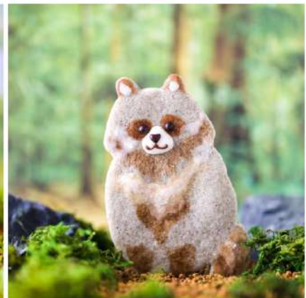
ボンドタヌキは冬に毛がふわふわになって可愛い。手足は焦茶色。