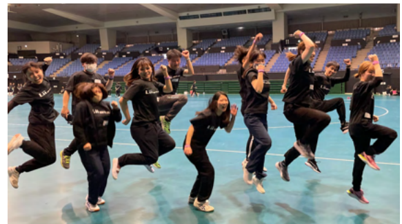
▲左全社会議「シャトルラン」風景（2023年4月）、右チーム写真（2023年4月）