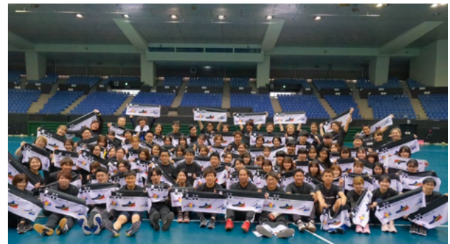
▲左上会場イメージ写真、右総勢80名の集合写真（2023年4月）