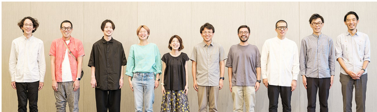
クラシコム テクノロジーグループ