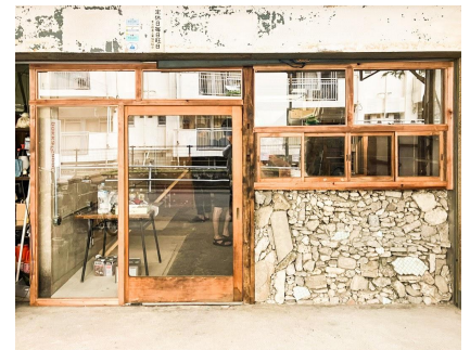
<左:自転車屋@愛知県瀬戸市 中央:本屋@愛知県名古屋市 右:カフェギャラリー@東京都南麻布>