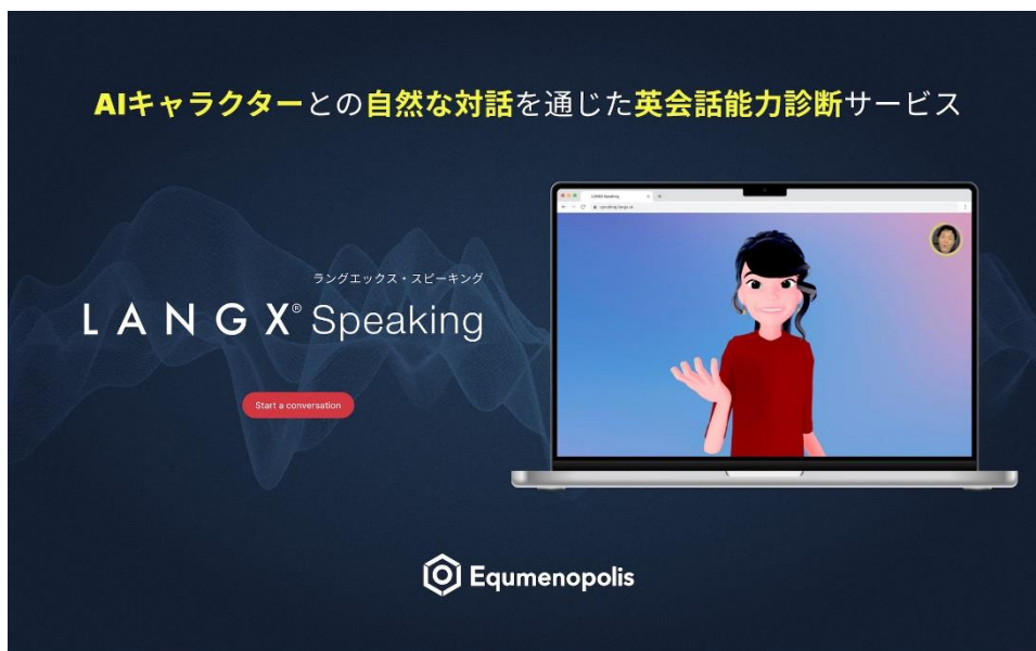
英語スピーキング能力診断「LANGX Speaking」

従来の英語能力自動判定テストで、他者と会話するうえで重要とされる「インタラクティブ性」を捉えることが難しいという問題点がありました。LANGX Speaking では、会話 AI エージェントが自然なインタビューやロールプレイ対話を通して学習者の能力を引き出し、トータル的なスピーキング能力判定を行い、その判断根拠と結果、さらに次の学習課題を詳細にレポート。会話するほどに学習者を知り、より適切なフィードバックをお届けすることができます（特許出願済）。