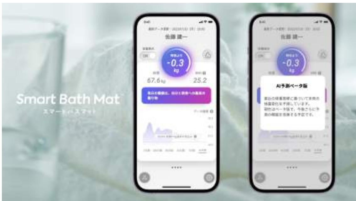
「AI予測機能（ベータ版）」の画面イメージ

目標達成時期の予測は、ダイエット期間中のモチベーション維持・向上に役立ち、リバウンド傾向の予測は、リバウンド防止へ向けた行動変革に繋がります。今後、他のモードへも順次追加予定です。