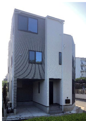
Kolet 竹ノ塚東 (東京都足立区西保木間 2 丁目)