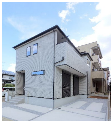
Kolet 蓮田 (埼玉県蓮田市大字井沼)