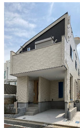
Kolet 新江古田 (東京都中野区江原町 1)

< Kolet ブランドコンセプトムービー : https://onl.bz/UkJ7Y6w >