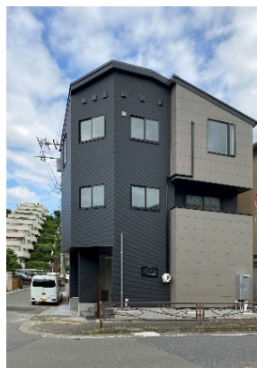
Kolet 多摩寺尾台 (神奈川県川崎市多摩区寺尾台 1 丁目)