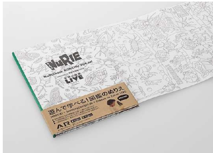
NuRIEbook KONCHU ZUKAN