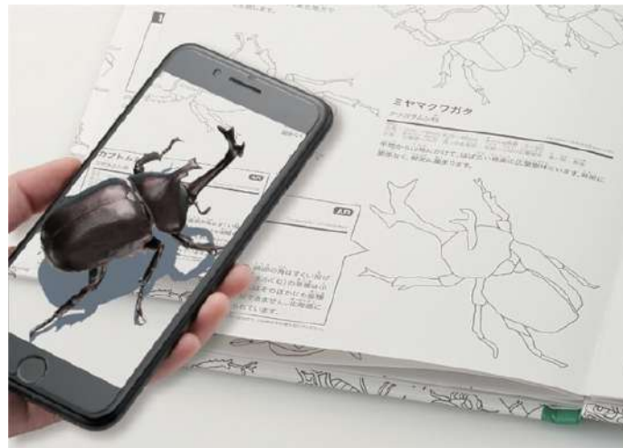
「学研の図鑑 LIVE」の AR 機能に対応