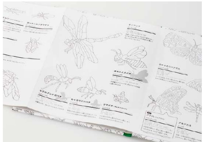
表面は長いぬりえ、裏面は「学研の図鑑 LIVE」が監修した解説入りの図鑑