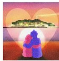
【入賞】江ノ島と恋人