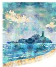
【入賞】SHONAN bright textile