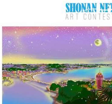
【絆部門 大賞】SHONAN Dreaming -2-