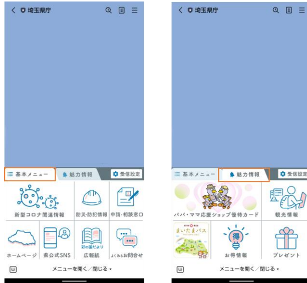
図 4 埼玉県 LINE 公式アカウントのリッチメニュー

メニュー画面上部のタブにより、メニューを「基本メニュー」「魅力情報」に切り替え可能。基本メニューは7種類、魅力情報は5種類のメニューから、知りたい情報にアクセス可能に