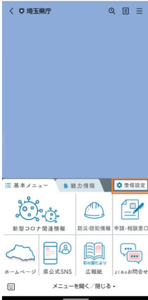
図 5 「受信設定」方法

メニュー画面上部のタブにより、メニューを「基本メニュー」「魅力情報」に切り替え可能。基本メニューは7種類、魅力情報は5種類のメニューから、知りたい情報にアクセス可能に