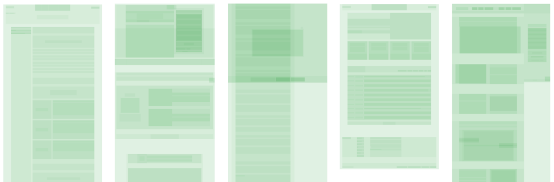
WebサイトのデザインをAIが抽象化（分析の過程）