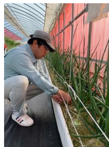
(ハウスコムファームでの作業の様子)