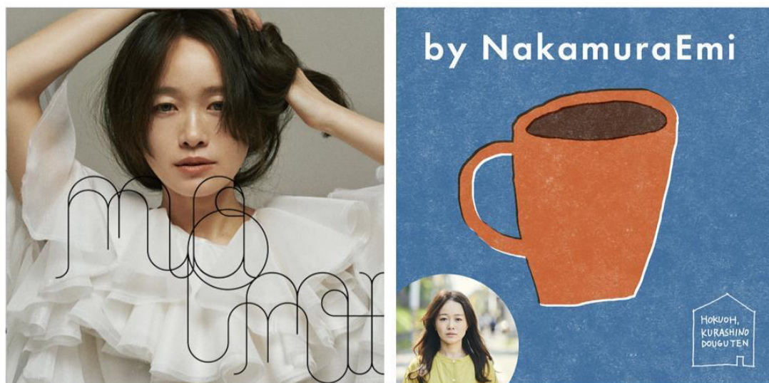
Album 『Momi』 発売に合わせて公開されたプレイリスト

事例2：[心と体をほっとさせる時間に。シンガーソングライター・NakamuraEmiさん選曲のプレイリストができました] URL： https://hokuohkurashi.com/note/238551