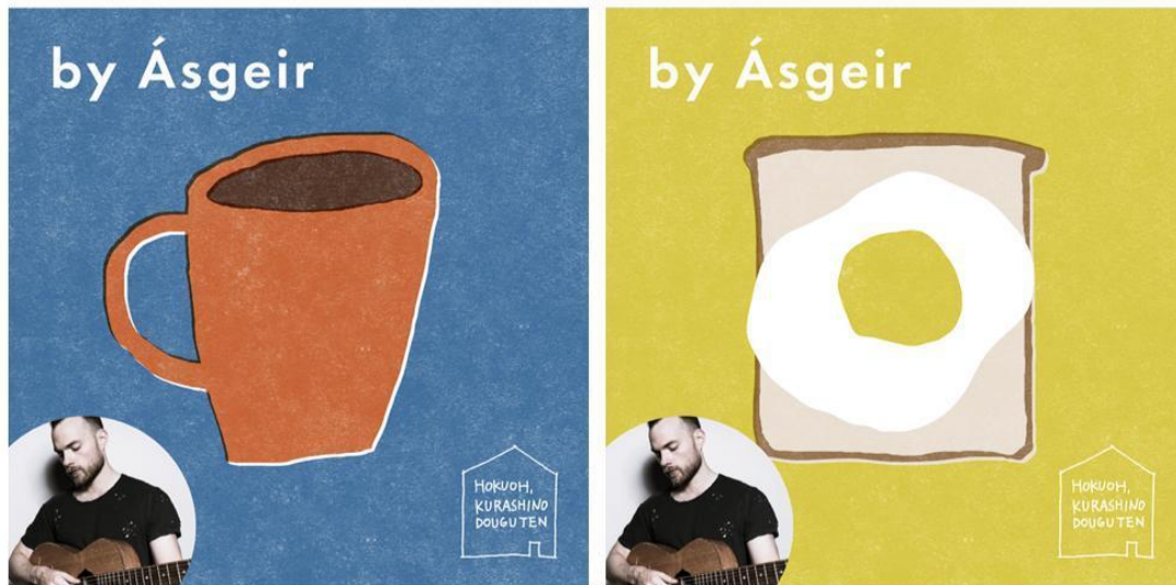
Album 『Bury The Moon』 の日本盤リリースに合わせて公開されたふたつのプレイリスト

事例1：[アーティストを迎えた特別版！ Ásgeir（アウスゲイル）さん選曲の2つのプレイリストができました] URL： https://hokuohkurashi.com/note/208021