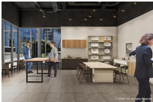
▲リニューアル後のイメージパース