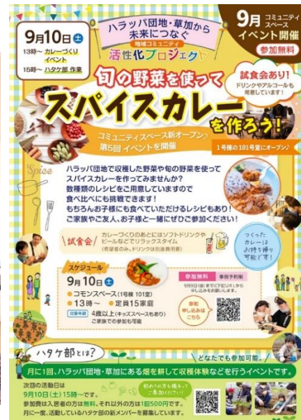
(今年9月開催「スパイスカレー作り」の様子、いろんなスパイスを調合して食べ比べるイベント)