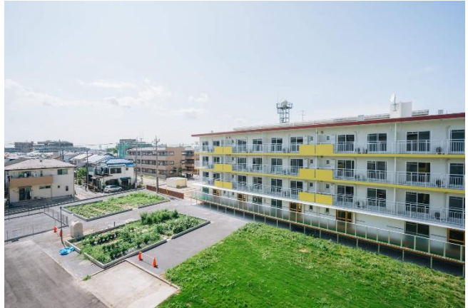
(左手前より) ドッグランや各種畑、庭が広がる

ハラッパ団地・草加とは、1971年に建築された埼玉県・草加市の社員寮だった物件を、2018年にリノベーションを実施し再生した全55戸の賃貸住宅です。農園・保育園・ドッグラン・キッチン付きイベントスペースなどが併設されている点が最大の特徴で、「リノベーション・テクノロジー・コミュニケーション」をかけ合わせて、多様性を認め合い、人だけでなく動物とも共存できる空間を提供しています。