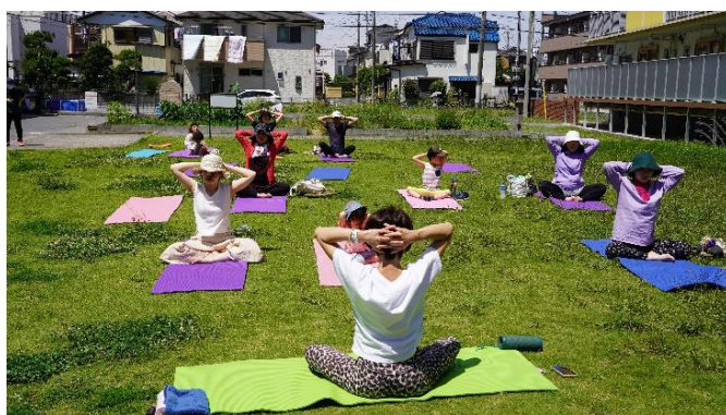
(6月に行ったヨガ教室の様子)