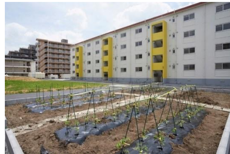
広場の一角にあるシェア畑