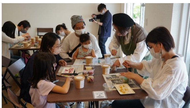
(5月に行ったポタニカルキャンドル作りの様子)