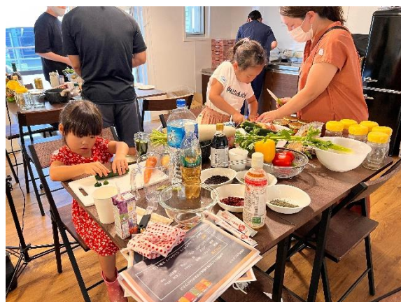
(8月に行ったピクルス作りの様子)