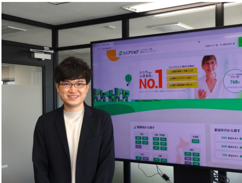
シニア専門求人メディア「シニアジョブ」のTOPページとシニアジョブのSEO担当者

シニアジョブのSEO専門担当者(本人の希望により氏名非公開)がスピーカーを務め、求人メディア「シニアジョブ」に関する検索結果や流入状況に関する経過の報告がなされたほか、求人メディアを含めた事業戦略に即してどのような段階と計画で施策が実行されているのか、その結果、求職者や求人企業にどのような効果や変化が発生しているのか、さらにSEO担当だけでなくエンジニアメンバーの活躍など、シニアジョブの開発とマーケティングの広い領域に渡ってのメッセージが出されました。