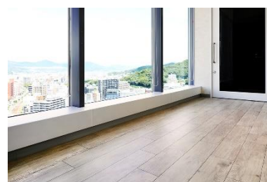
▲レストスペースで採用されたメラミンタイル

2019 年 7 月発売。当社の主力製品であり耐久性やメンテナンス性に優れる「メラミン化粧板」と、商業施設の床材として多く使用されている「塩化ビニル樹脂(塩ビ)系床材」の長所を組み合わせ、新しい床材です。ヒールマークやゴム製キャスター汚れ、タバコの焦げなどに強く、汚れても水拭きで簡単にお手入れ可能。ノンワックスで美観が保たれるためワックスコストも不要です。