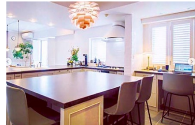
▲自宅のワークスペース