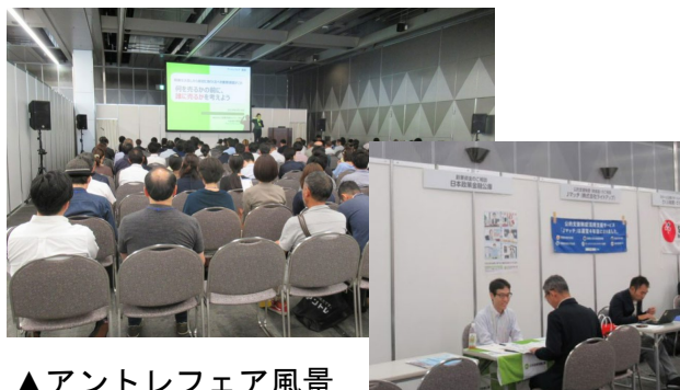
▲アントレフェア風景