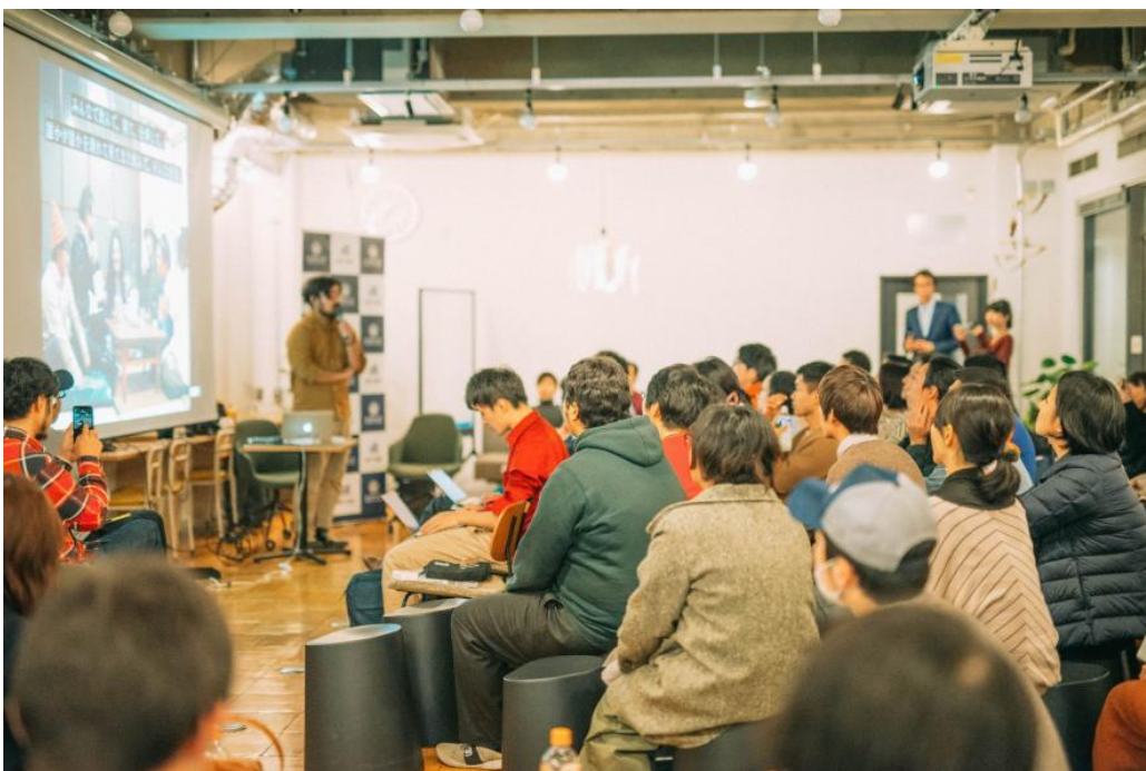
↑2019年冬に名古屋市内で行ったイベントの様子 約100名の方がご参加し、「空き家を借りて〇〇がしたい！」という声が続々と挙がる熱い時間でした