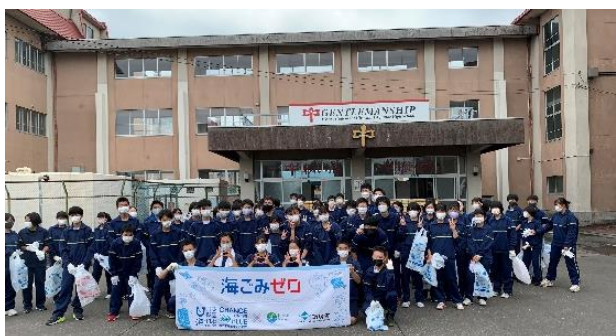
▲弘前市立第一中学校の生徒