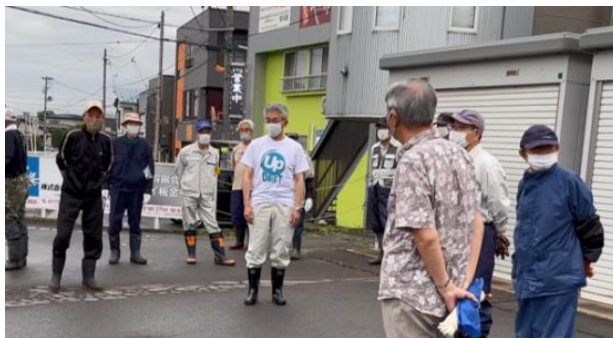
▲漂着ペットボトル等から再生したTシャツを着用して参加する弘前市長

当日は、弘前市長をはじめオンワード商事社員、弘前市立第一中学校・弘前市立東中学校の生徒や地域住民等 1395 名が参加し、市内の 5 河川（土淵川、寺沢川、大和沢川、前川、腰巻川）を含む約 80 ヶ所の清掃を行いました。当社の社員は漂着ペットボトル等から再生した T シャツを着用して参加し、河川のゴミ問題の自分ごと化や解決に向けた啓蒙活動にも注力しました。