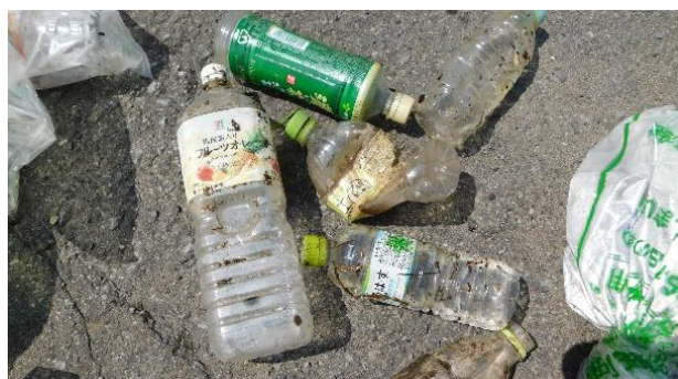
▲清掃活動によって回収したペットボトルの一部