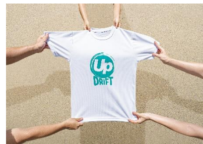
▲Tシャツなどの繊維製品へ