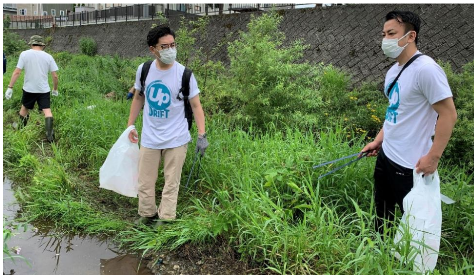
▲当社の社員が河川の清掃を行う様子