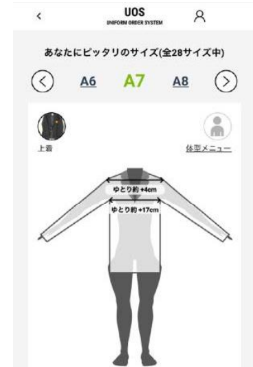
▲レコメンド画面のイメージ

従来行われてきた紙や Excel を用いた採寸情報の管理は、人為的な作業ミスにつながるリスクがありましたが、「UOS」ならオーダー受付時に自動集計します。さらに生産サイズ明細の精度向上によって発注後の返品・交換を減らし廃棄数を削減しました。