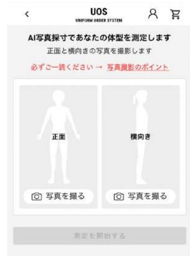
▲写真撮影画面のイメージ

機械学習アルゴリズム（AI）を用い、スマートフォン端末で撮影した正面と側面の全身写真から、腕の長さや肩幅などの体型を採寸します。従来のように会場に赴き対面で採寸することなく、リモートでの採寸を実現しました。