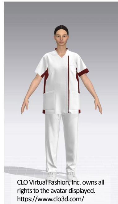
▲Raffiriaのメディカルウェアを着用した3Dアバター

世の中のデジタル化が進む中、アパレル業界はデジタル化が遅れていると感じますし、次第にデジタルが、そして「CLO」を使うことが当たり前になるのではと考えられます。時代の波に乗り遅れず、ユニフォーム業界内でも先駆けとしてこの「CLO」を活用していくことで、他社との差別化を図ることが出来ると私は思います。「CLO」を今後も有効活用できるよう、社内体制を整え、当社の提案の1つの武器として活用していきます。