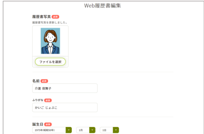
(PCでの操作画面イメージ：転職カレンダー／Web履歴書)